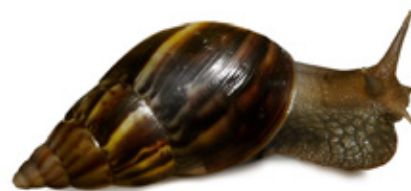
Achatina fulica. "Caracol Gigante Africano".

CARA-BA incluso elimina a los gigantes caracoles africanos. El Achatina fulica es una especie exótica invasora, que al no tener depredadores se volvió plaga en el norte y centro de nuestro país. Devora cultivos y jardines, además de ser un foco transmisor de parásitos que afectan a la salud humana.